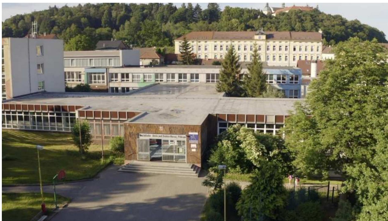
Základní škola pod Svatou Horou, Příbram

ŠK - rozloučení se školním klubem před prázdninami