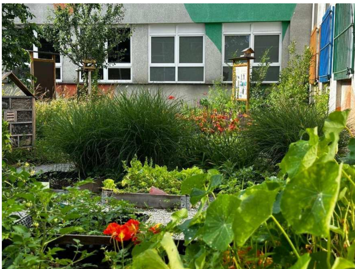
Venkovní učebna s jezírkem